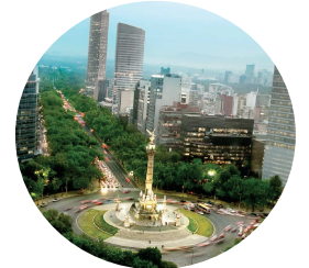
México Octubre 13 al 15 de Octubre del 2017 Polirofum, León