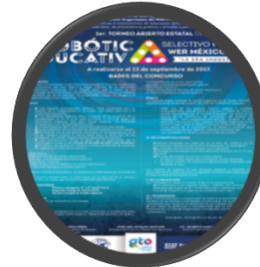
Torneo Estatal Guanajuato 22 de Septiembre Comudaj, Irapuato