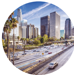
Los Ángeles Septiembre